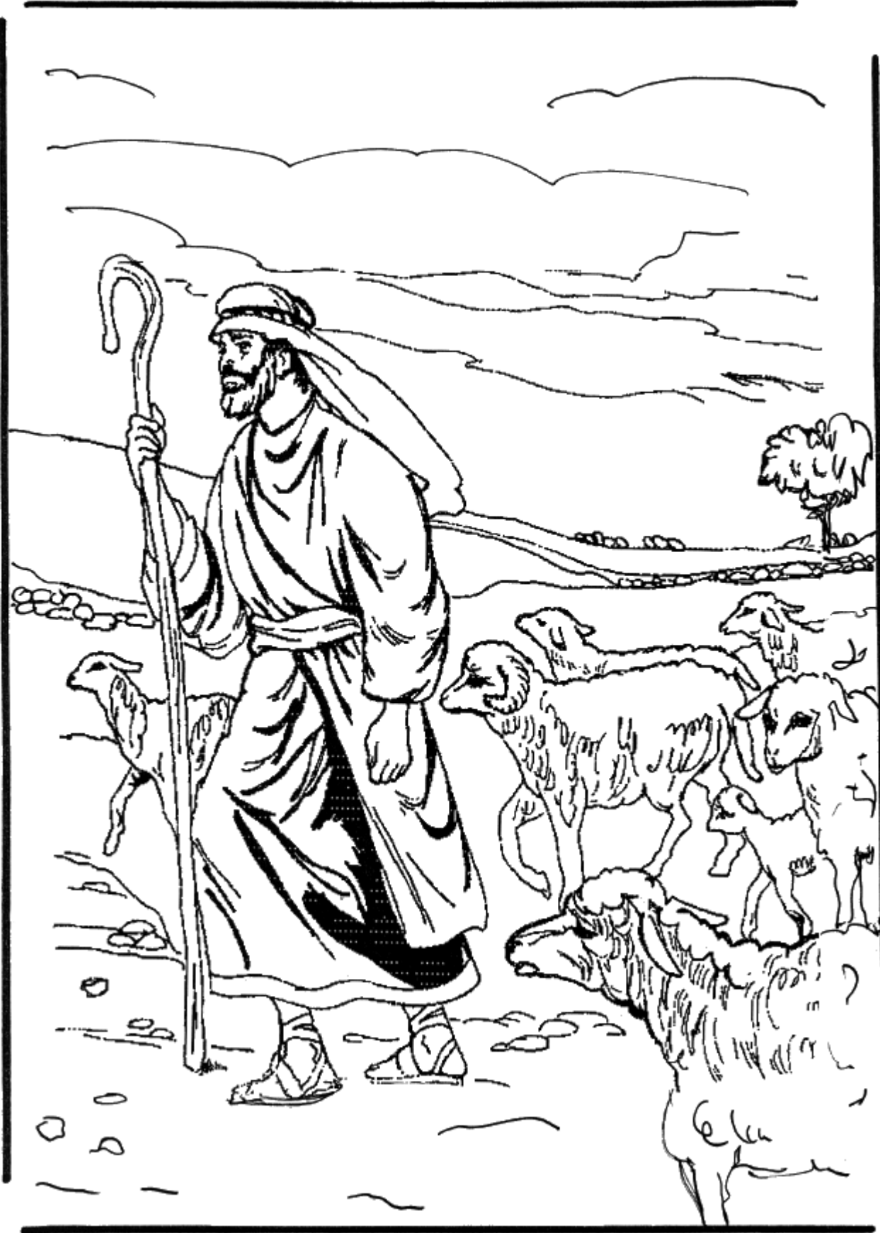
Hij zorgt voor zijn schapen